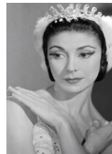
= Margot Fonteyn