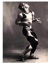
= Vaslav Nijinski