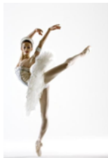
= Polina Semionowa