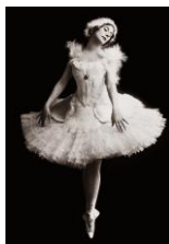
= Anna Pavlova