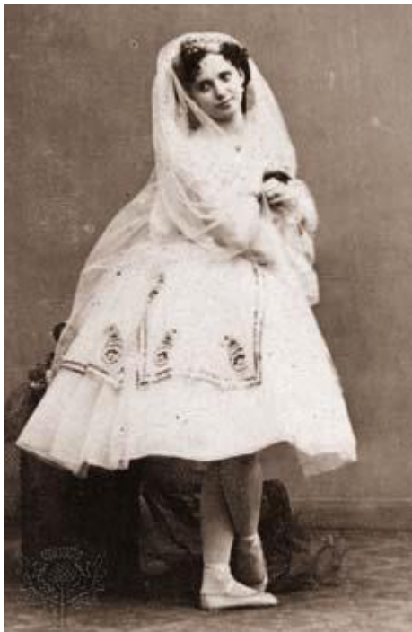
Maria Taglioni, mit wadenlangem Tutu

Ein Tutu ist ein Ballettkleid, dessen Rock aus mehreren Lagen Tüll besteht. Bevor das Tutu entstand trugen die Tänzerinnen Reifröcke. Das erste Tutu wurde 1832 von Maria Taglioni in Le Sylphide getragen. Damals, in der „romantic Period“, waren alle Tutus wadenlang. Mit der Zeit wurden die Tutus immer kürzer und erst 1950 wurden die auch uns bekannten Puderquasten-Tutus genäht.