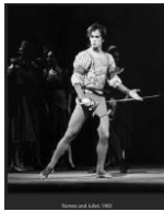
= Rudolf Nurejew