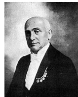
= Enrico Cecchetti